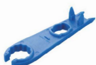
引抜・ナット締付け兼用 クランプレンチ